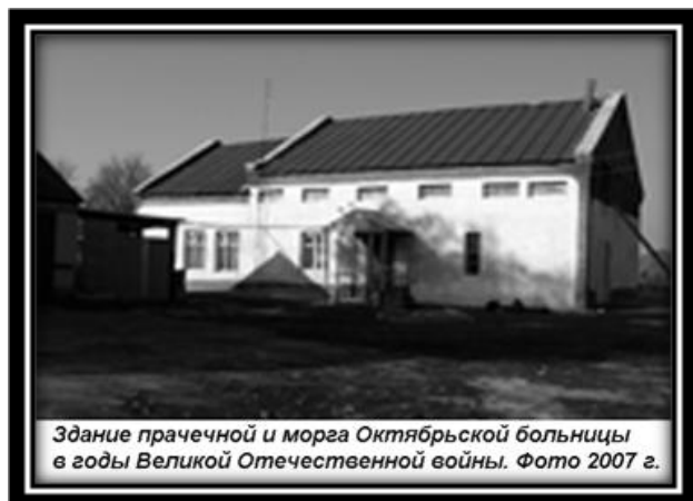
Фото 1. Здание прачечной и морга Октябрьской больницы в годы Великой Отечественной войны.