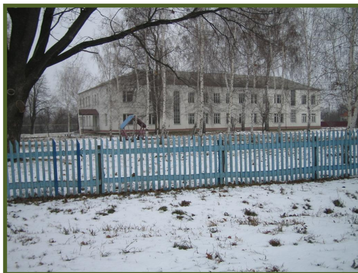
Фото 9. Октябрьская больница

Здесь в годы Великой Отечественной войны располагались госпитали. Современный вид больницы.