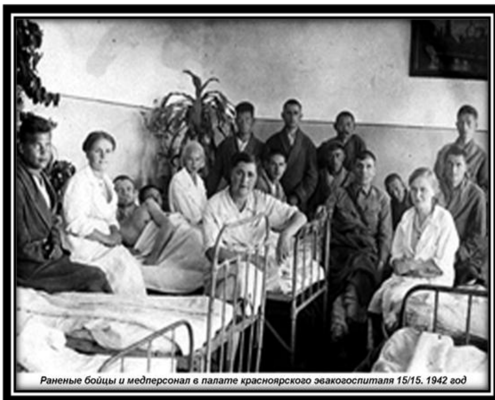
Фото 6. Красноярский эвакогоспиталь 15/15 на территории Дрязгинской больницы.