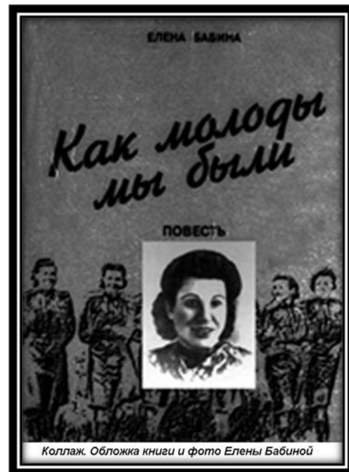
Фото 2. Книга Е. Бабиной «Как молоды мы были»